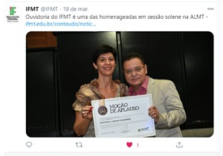
Figura 13. Homenagem - Moção de aplausos

Em 2021, além da continuidade das ações, serão consolidados o Plano de Gestão para monitoramento e proteção dos dados pessoais - mapeamento de processos - e a implantação do Conselho de Usuários.