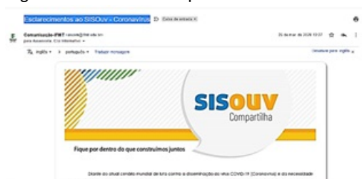
Figura 11. SisOuv Compartilha

Outra campanha que a ouvidoria divulgou refere-se à “Campanha Cidadania em foco” (Fig. 12), publicada na página oficial da instituição e divulgada nas redes sociais.