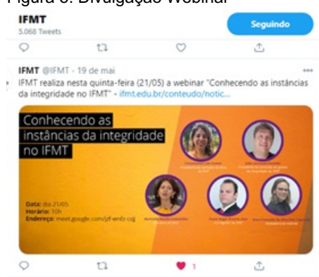
Figura 5. Divulgação Webinar

3. Semana Pedagógica Campus Várzea Grande