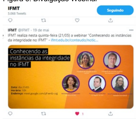
Figura 5. Divulgação Webinar

3. Semana Pedagógica Campus Várzea Grande