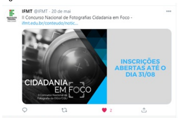
Figura 12. Cidadania em foco

Campanha Solidária Abraços à Vida. Trata-se de uma Campanha solidária com o objetivo de sensibilizar as populações sub-representadas de Cuiabá para o uso de máscaras. “Abraços à vida” distribuiu máscaras, álcool 70%, brinquedos e roupas para as populações migrantes de Cuiabá e em situação de sociovulnerabilidade. Feita em parceria com a Escola Superior de Defensoria Pública de Mato Grosso, o Gabinete da Reitoria, a Ascom, a Ouvidoria e o Numdi. Foram feitas reportagens sobre a campanha, que podem ser lidas em: http://www.defensoriapublica.mt.gov.br/-/14184193-escola-superior-numdi-e-ifmt-lancam-campanha-abracos-a-vida-para-levar-esperanca-a-quem-pede-ajuda-nos-semaforos-de-cuiaba http://numdi.ifmt.edu.br/conteudo/noticia/escola-superior-numdi-e-ifmt-lancam-campanha-abracos-vida-para-levar-esperanca-quem-pede-ajuda-nos-semaforos-de-cuiaba/