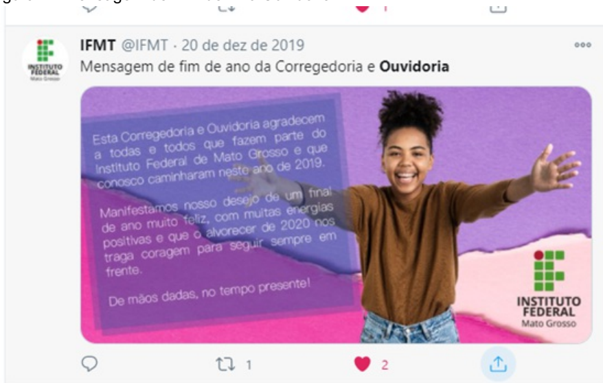
Figura 1 - Mensagem de Fim de Ano Ouvidoria IFMT

A mensagem foi divulgada no Portal do IFMT, enviada por e-mail a todos os servidores da Instituição e também publicada nas redes sociais.