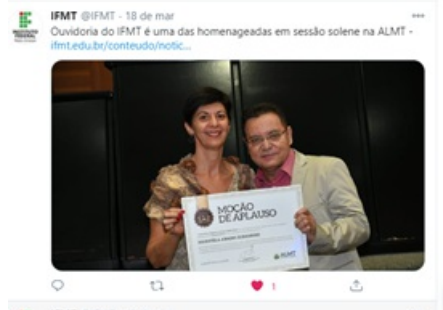
Figura 13. Homenagem - Moção de aplausos

Em 2021, além da continuidade das ações, serão consolidados o Plano de Gestão para monitoramento e proteção dos dados pessoais - mapeamento de processos - e a implantação do Conselho de Usuários.