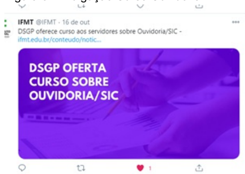
Figura 6. Divulgação Curso Ouvidoria

http://ifmt.edu.br/conteudo/noticia/dsgp-oferece-curso-aos-servidores-sobre-ouvidoriasic/