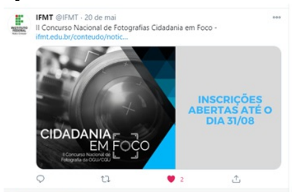
Figura 12. Cidadania em foco

Campanha Solidária Abraços à Vida. Trata-se de uma Campanha solidária com o objetivo de sensibilizar as populações sub-representadas de Cuiabá para o uso de máscaras. “Abraços à vida” distribuiu máscaras, álcool 70%, brinquedos e roupas para as populações migrantes de Cuiabá e em situação de sociovulnerabilidade. Feita em parceria com a Escola Superior de Defensoria Pública de Mato Grosso, o Gabinete da Reitoria, a Ascom, a Ouvidoria e o Numdi. Foram feitas reportagens sobre a campanha, que podem ser lidas em: http://www.defensoriapublica.mt.gov.br/-/14184193-escola-superior-numdi-e-ifmt-lancam-campanha-abracos-a-vida-para-levar-esperanca-a-quem-pede-ajuda-nos-semaforos-de-cuiaba http://numdi.ifmt.edu.br/conteudo/noticia/escola-superior-numdi-e-ifmt-lancam-campanha-abracos-vida-para-levar-esperanca-quem-pede-ajuda-nos-semaforos-de-cuiaba/