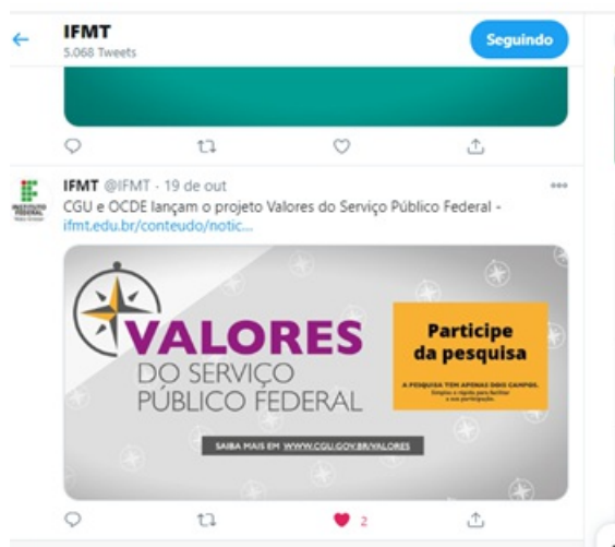
Figura 10. Campanha Valores

Aderimos também à campanha de “Esclarecimentos ao SISOUV - Coronavírus Sisouv na Pandemia” e enviamos por e-mail aos servidores e também publicamos na página do IFMT e nas redes sociais, para divulgação. (Fig. 11).